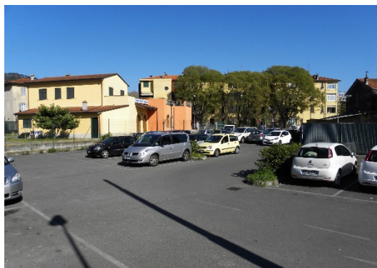
Piazzale S.Cabassi (Comune della Spezia)