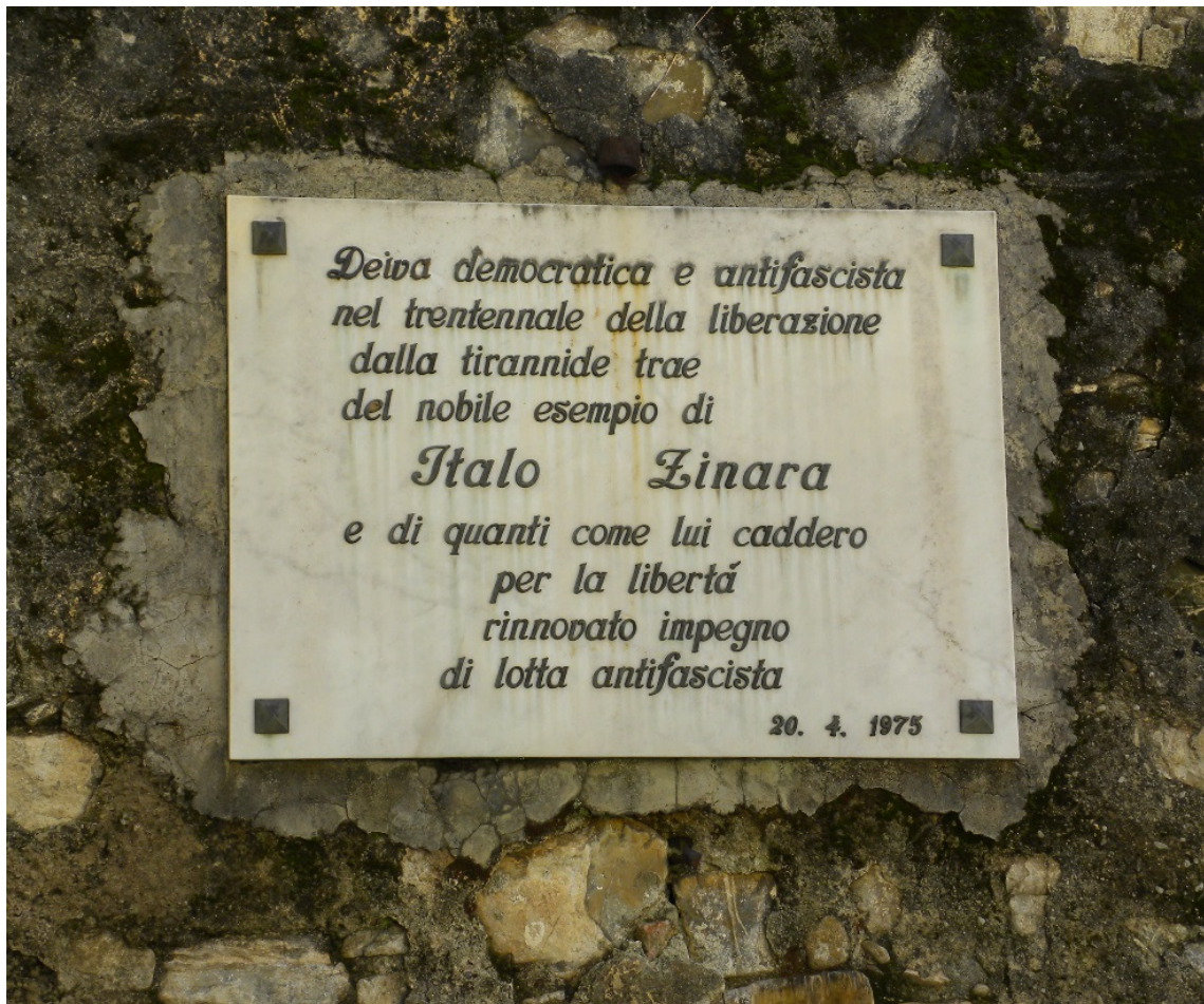
Targa in Piazza Italo Zinara